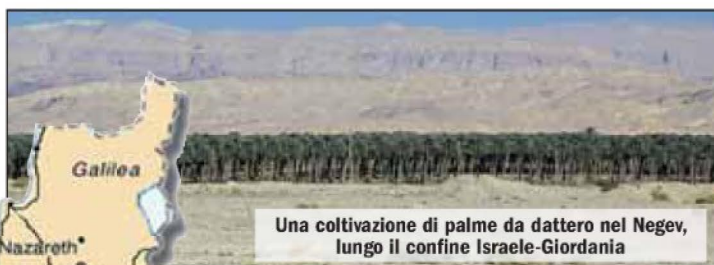
Una coltivazione di palme da dattero nel Negev, lungo il confine Israele-Giordania