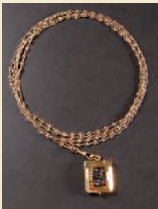
121. CATENA IN ORO GIALLO CON CIONDOLO PORTAFOTO CON PIETRA DURA TIPO CAMMEO Eredità Amanda Cantoni Spaggiari