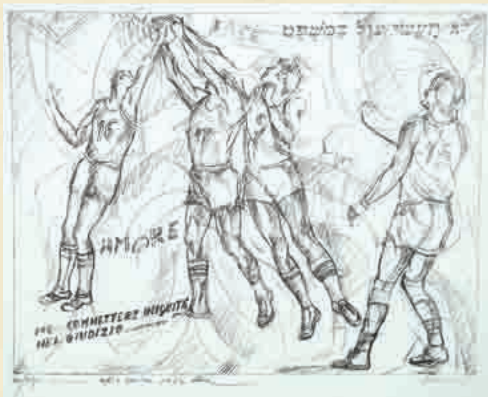
119. DANIEL SCHINASI, GRUPPO DI 5 SERIGRAFIE RAFFIGURANTI GLI SPORT, OGNUNA FIRMATA, TITOLATA A MATITA ED ISCRITTA AL RETRO (CM 68X49). Donato dall'Autore