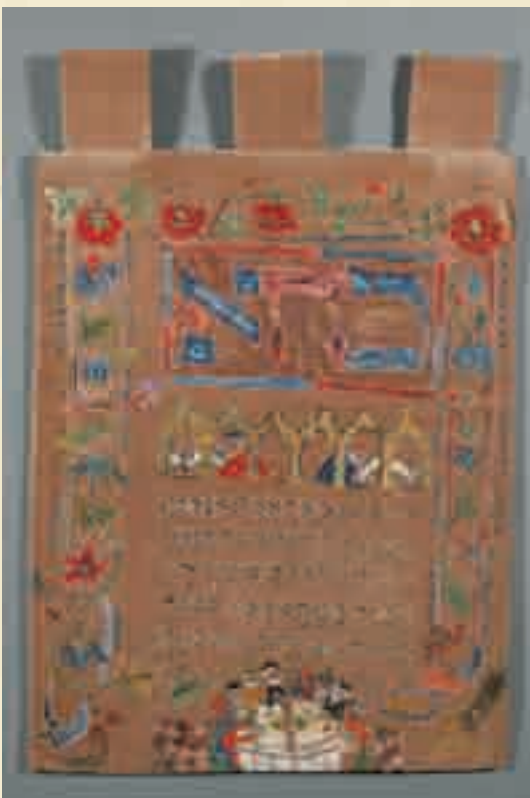
97. PANNELLO IN VELLUTO RICAMATO DECORATO IN POLICROMIA CON PASSO DELLA HAGGADAH (NARRAZIONE) DI PASQUA (CM 39,5x30).