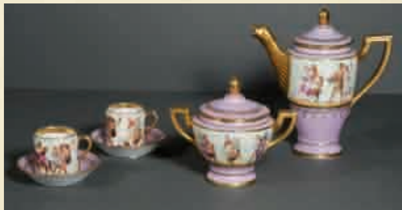
98. MANIFATTURA DI VIENNA, FINE SEC. XIX SERVIZIO DA CAFFÈ TETE-A-TETE IN PORCELLANA A FONDO ROSA DECORATO IN POLICROMIA A FIGURE MITOLOGICHE. PRESE SAGOMATE E DORATE.